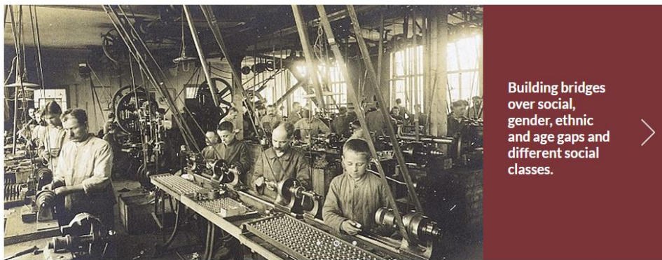
VIRTUAL REALITY ARCHIVE LEARNING (VIRAL)