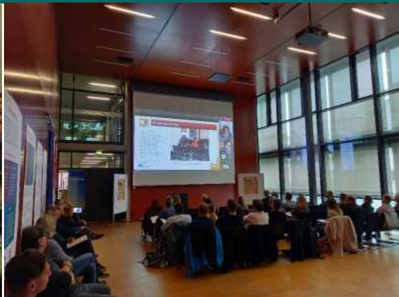
Den avslutande konferensen

(och du... vi finns på Facebook! Följ oss )