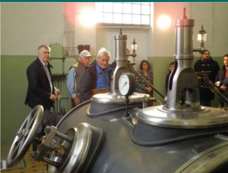
Vi är ute och utforskar industriarvet i Dornbirn